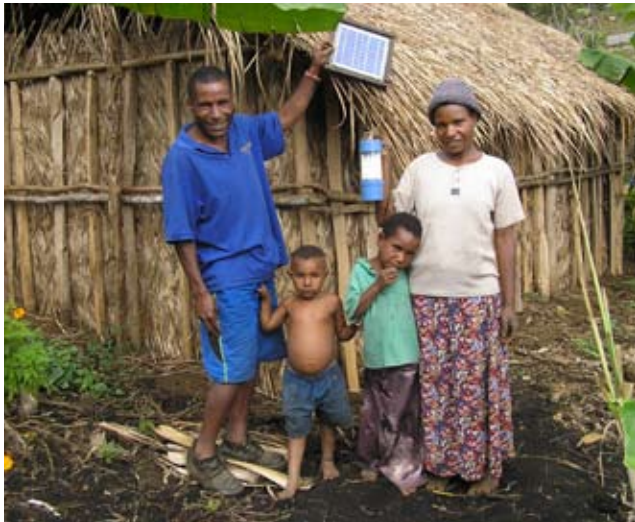
Die Förderung von Solarlampen in den Hochlanddörfern Papua-Neuguineas ist ein „klassisches“ Beispiel für ein Entwicklungsprojekt.

Auch hier findet sich der untrennbare Zusammenhang von Mission und Entwicklung: „Gott wendet sich mit seinem Heil an den ganzen Menschen. Geist und Leib, der Einzelne und die Gemeinschaft werden hinein genommen in Gottes befreiendes und hei-