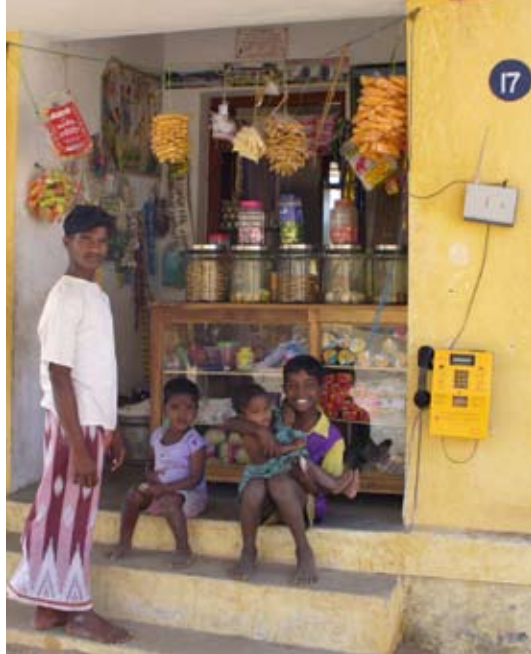
In Kadapakkam sind die Menschen inzwischen in ihre neuen Häuser eingezogen, die ihre durch den Tsunami zerstörten Hütten ersetzen.

angebracht. Abends wird der Tresen einfach schnell ins Haus geräumt.