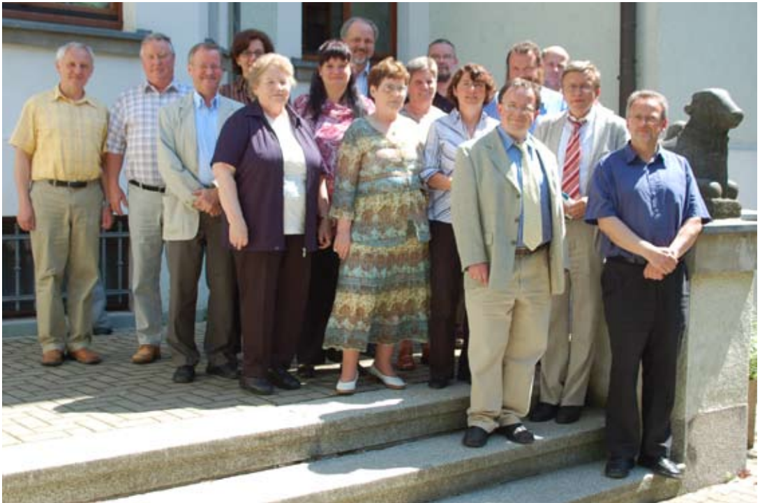
Der Missionsausschuss am 21. Mai 2007.

genannten Kirchen und der Missionsausschuss haben deren Mitglieder bestimmt.