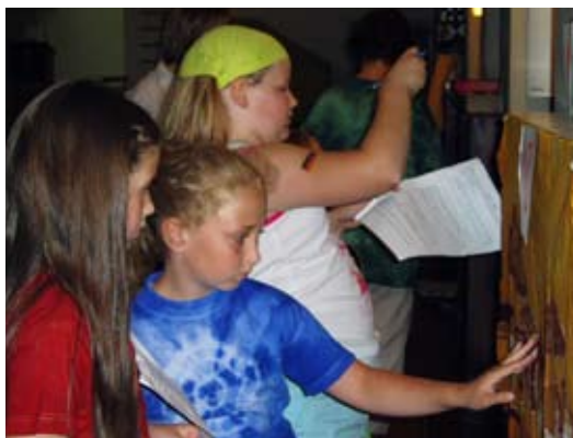
Bei der Länder-Rallye in der Gohliser Versöhnungskirche kamen auch die jüngeren Jahresfestbesucher auf ihre Kosten.

Das 2. Internationale Weihnachtsfest mit seiner musikalischen Vielfalt und kreativen Mitmachmög-