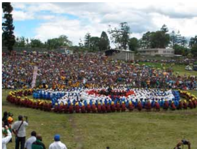
Zur Eröffnung der Synode wurde im Stadion von Goroka im Hochland von Papua-Neuguinea eine Lutherrose gestellt.