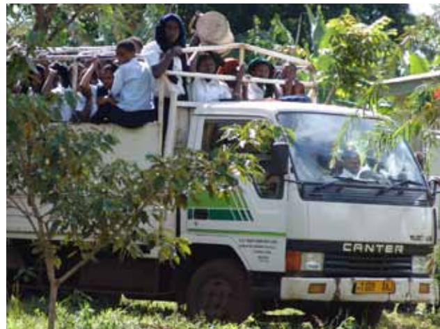
In Tansania sind die Transporte bei Reisen vor allem von Jugendgruppen häufig abenteuerlich. Mögen alle heil an ihren Zielen ankommen.