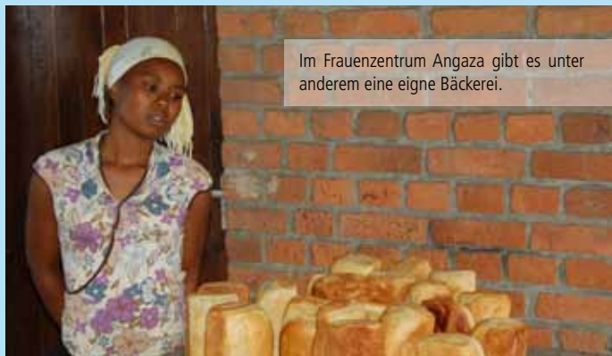
Im Frauzentrum Angaza gibt es unter anderem eine eigne Bäckerei.