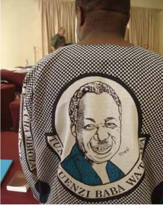
Der erste Präsident des Landes Julius Nyerere ist immer noch präsent. Sein Bild hängt in Läden oder wird auf Hemden und Kangas getragen.

Die „Wende“ 1989 bei uns ermöglichte Reisefreiheit und direkte Kontakte zwischen Gemeinden und kirchlichen Gruppen hier und dort, Kommunikation und Austausch von Informationen – später per Internet und SMS – und auch die Unterstützung von Jugendlichen der Partnergemeinden mit Schulgeld für die Oberschul- und Berufsausbildung.