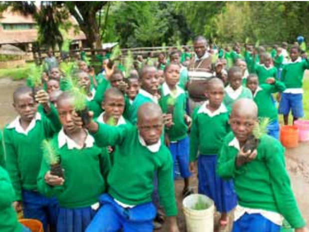
Die Kinder der Grundschule Kinyika holten sich Setzlinge aus der Baumschule der Südwest-Diözese, um sie auf ihrem Schulgelände zu pflanzen.

Bei meinen Besuchen in den einzelnen Diözesen der ELCT werde ich oft zu Projekten geführt. Es sind ganz unterschiedliche Einrichtungen, die sich in der Trägerschaft von Gemeinden, Kirchenkreisen oder Diözesen befinden. Das sind Schulen und Ausbildungseinrichtungen unterschiedlichster Art. Die lutherische Kirche besitzt Krankenstationen und Hospitale, unterhält Waisenhäuser und Aids-Projekte. An vielen Stellen komme ich dann auch zu „income generating projects“, Einkommen schaffenden Projekten.