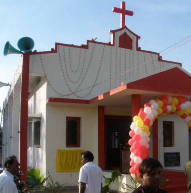
Wurde am 22. Januar eingeweiht: Die Jubiläumskapelle in Thaneerkulam im südostindischen Tamil Nadu.