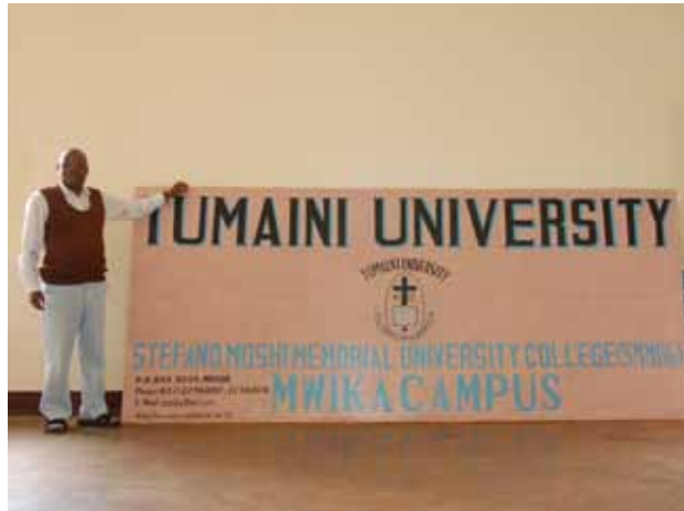
Das Schild ist schon fertig: Auf dem Campus der Bibelschule der Nord-Diözese in Mwika ist eine Universität geplant.

Ich weiß, dass kirchliche Projekte in Deutschland