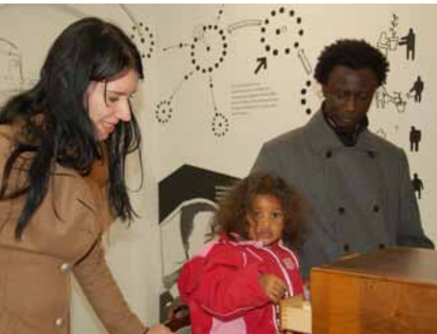
Viele Gäste des Interkulturellen Weihnachtsfestes nutzen die Gelegenheit, sich die Dauerausstellung des LMW anzuschauen.