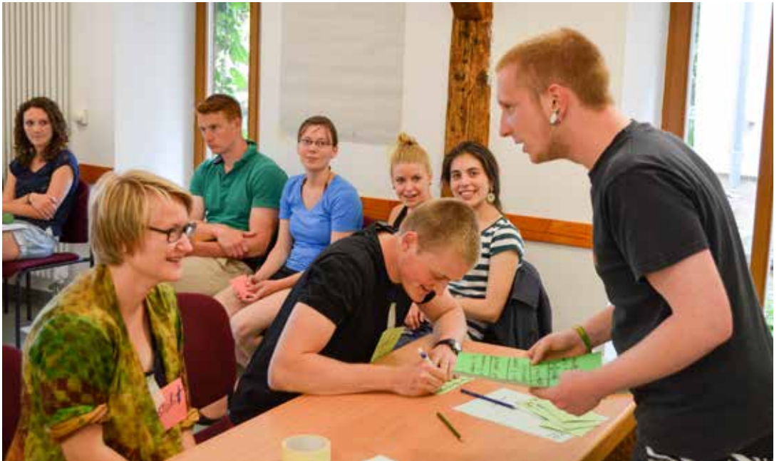
Die Nord-Süd-Freiwilligen des Leipziger Missionswerkes absolvieren sowohl länderübergreifende als auch länderspezifische Seminare zur Vorbereitung auf ihren Freiwilligendienst. Auch an einem entwicklungspolitischen Seminar müssen sie teilnehmen.

Auf der einen Seite glauben die Freiwilligen, das wahre, un-verzerrte Bild der Gesellschaft, in der man gerade für einen Freiwilligendienst lebt, zu kennen und zu verstehen – sei es in Tansania, Indien, Papua-Neuguinea oder Deutschland. Wir lesen darüber, wie integriert und zugehörig sie sich fühlen und andererseits eine Selbstdarstellung, die sie in ganz besonderer Mission zeigt – als Exot, Abenteuerer, Privilegierter: Ein Freiwilliger umringt von aufschauenden jubelnden indischen Kindern, eine Freiwillige mit geflochtenen Haaren am Strand von Sansibar, ein Freiwilliger vor dem neuestem BMW-Model in Leipzigs Innenstadt ... Ist es vielleicht doch nicht so leicht, so richtig dazuzugehören?