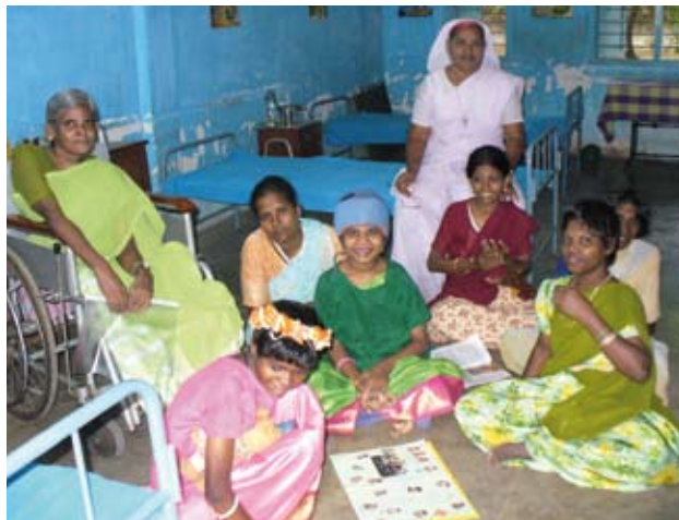
Die Frauen und Mädchen aus dem Behindertenheim Bethesda freuen sich über den Bildergruß aus dem sächsischen Rochlitz.

Ferner ist das Missionswerk in der EMW-Kommis-