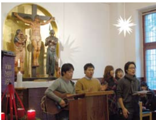
Der Gospelchor der Koreanischen Gemeinde sorgte für die musikalische Umrahmung des Internationalen Weihnachtsfestes.

Das 3. Internationale Weihnachtsfest am 15. Dezember 2007 widmete sich den Engeln. Im Kellergewölbe wurde eine Ausstellung mit Engelzeichnungen von Kindern aus unseren Partnerkirchen