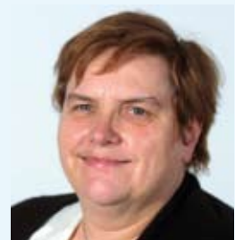
Marita Krüger, Oberkirchenrätin und Visitatorin im Aufsichtsbezirk Süd der Evangelisch-Lutherischen Landeskirche Thüringen