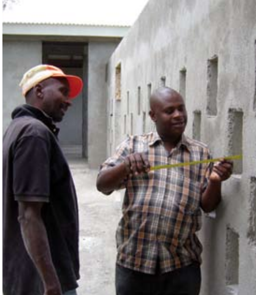
Dank des Thüringer Elisabethprojekts kann 2008 die Geburtsstation für das Krankenhaus in Orkesumet eingeweiht werden.

zu Ende. Ihr engagiertes Wirken ist in vielfältigerweise an den positiven Veränderungen in den Dörfern erkennbar. In Makuyuni wurde eine Kirche gebaut und für einen Amtskollegen ein Dienstsitz geschaffen.