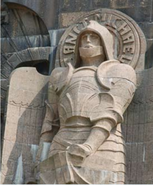
Am Leipziger Völkerschlachtdenkmal steht der Erzengel Michael mit seinem Feuerschwert an zentraler Stelle.

Nationen vom 10. Dezember 1948 sich in diesem Jahr zum 60. Mal jährt.