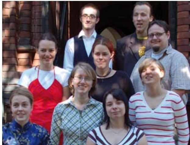
Neun der elf Freiwilligen, die beim Jahresfest 2007 in der Leipziger Kirchgemeinde Lindenau-Plagwitz ausgesendet wurden.