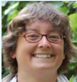
Kathrin Skriewe, Kirchenrätin für Ökumene und gesellschaftliche Verantwortung in der Evangelischen Kirche in Mitteldeutschland, Eisenach