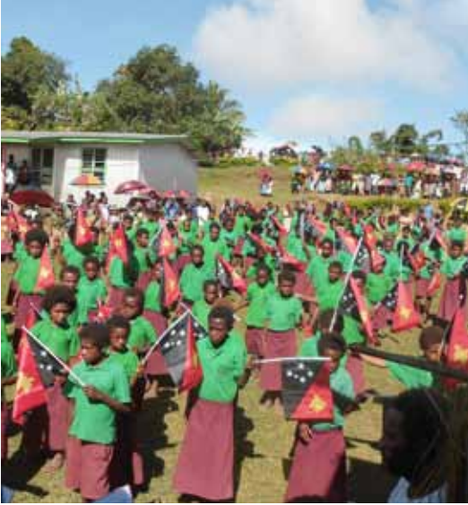
Grundschule auf dem Sattelberg (Finschhafen, Papua-Neuguinea)

Einen kleinen Spielraum gab es aber noch: 1958 beschloss die Regierung, alle ausgenommenen Schulen auf das Niveau der staatlich anerkannten Schulen anzuheben. Weil viele Missionsschulen jedoch in sehr isolierten Gegenden lagen, konnten die Beamten sie nicht alle besuchen, was den Prozess verlängerte. So dauerte es noch weitere zehn Jahre, bis die Regierung 1968 die „Ausnahmeschulen“ endgültig zu „non-schools“ (Nicht-Schulen) klassifizierte. Das gab der Mission Zeit, sich neu zu orientieren. Ob dies eine gute Entwicklung in Bezug auf die Einheit der Stämme Neuguineas war, bleibt zu bezweifeln.