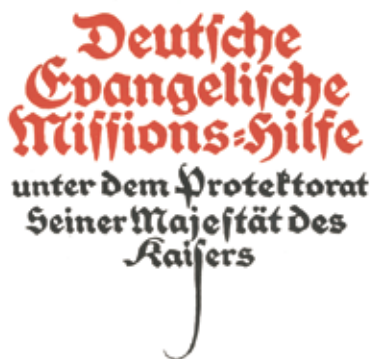
Deutsche Evangelische Missionshilfe im Kaiserreich – Vermischung religiöser und politischer Interessen

Als im Dezember 1913 das Geld verteilt wurde, entfielen auf Leipzig 230.000 Mark, und man war mit einem Mal schuldenfrei. Reichsweit kamen 3,2 Millionen Mark für die evangelischen und 1,3 Millionen für die katholischen Missionen zusammen. Nur eines hat-