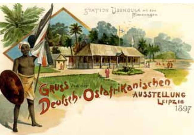
Grüßkarte von der Sächsisch-Thüringischen Industrie-Gewerbe-Ausstellung in Leipzig von 1897