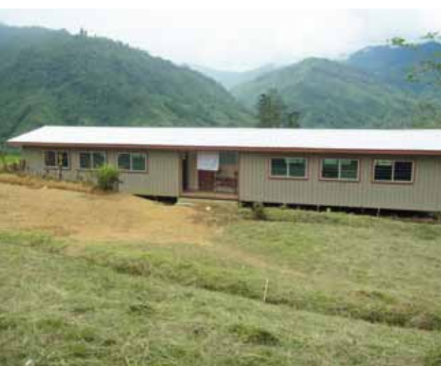
Schule in Kui (Kol Circuit, Papua-Neuguinea)

Man wählte damals Kâte und Jabêm aus den Regionen Finschhafen und Lae sowie Gedaged , das in der Madang-Region gesprochen wird. Diese drei Küstensprachen wurden somit auch als Medium für die Bildung genutzt. Welche Spuren diese weise Entscheidung hinterlassen hat, kann man heute noch sehen: Nicht nur die verschiedenen Stämme der Küstenbevölkerung, sondern auch die Mehrheit der Hochländer wurden durch diese drei Sprachen zusammengebracht. Kâte zum Beispiel wurde ursprünglich von nur einigen hundert Menschen gesprochen. 1959 waren es 100.000 Menschen.