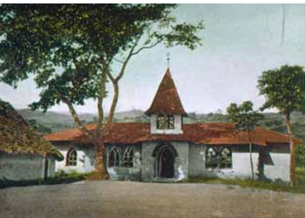
Historische Postkarte der Kirche in Kidia (Altmoschi)

gesellschaft lehnte eine blutige „Strafexpedition“ des Hauptmann Johannes nach der Ermordung zweier Leipziger Missionare 1896 im Meru-Gebiet nicht ab, was den Eindruck der Dschagga, dass es sich bei den Missionaren um Vertreter der Kolonialmacht handelte, wohl eher verstärkte.