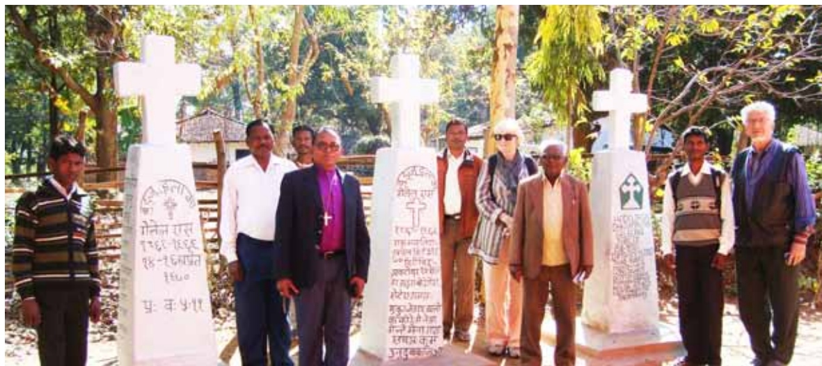
Anglikaner, Katholiken und Lutheraner sind heute Partner auf dem Missionsfeld in Chotanapur. Das war nicht immer so.

gemeinsamen Basis zusammengefunden. Die Blockmächte des Kalten Krieges bröckelten auseinander.