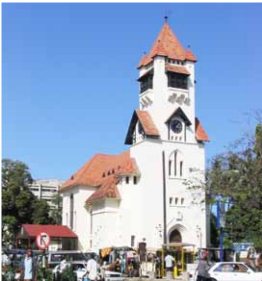
Lutherische Bischofskirche Azania Front Cathedral in Dar es Salaam