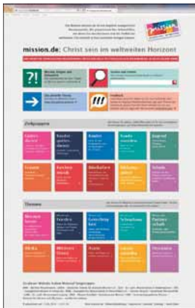
www.mission.de – Eine Datenbank mit Arbeitshilfen zum Thema Mission und Ökumene.

Für solche Fälle aus dem Leben von Pfarrerinnen und Pfarrern oder engagierten Ehrenamtlichen ist