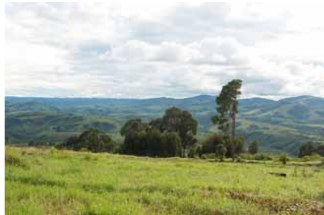
Blick von der Schule in Ipalamwa (Iringa-Diözese)

Europa, und so auch Deutschland, werden Ziel von