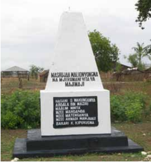
Maji-Maji-Denkmal in Kilwa Kivenje für von Deutschen hingerichtete Männer, die gegen die koloniale Besetzung gekämpft haben.

kern im Gebiet des heutigen Tansania durch ihre Zusammenarbeit mit der Kolonialverwaltung unterstützt haben.